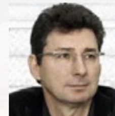
Manel Ruisanchez RUISANCHEZ ARQUITECTES www.ruisanchez.net