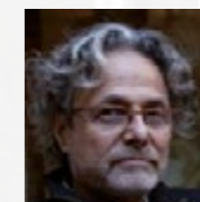
Santi Vives SANTI VIVES ARQUITECTURA www.santivives.com

Una de las salidas claves para revitalizar el sector de la arquitectura y la construcción es sin duda la rehabilitación, reforma, ampliación y cambio de usos del parque edificatorio existente. Por ese motivo, Grupo Vía reúne a estudios de arquitectura de primera línea para analizar los casos de éxito recientes en diferentes ámbitos y tipologías, para a través de ellos y con el debate final conocer cuáles son las oportunidades, retos y desafíos que supone la rehabilitación en un contexto como el actual.