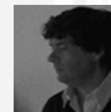
Ramón Andreu RAMON ANDREU · NURIA CANYELLES ARQUITECTES www.ram.cat