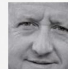
David Baena BCQ ARQUITECTURA www.bcq.es