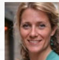
Judith López NANO3 ARQUITECTURA www.nano3arquitectura.com