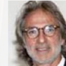
Josep Juanpere GCA ARCHITECTS www.gcaarq.com